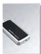
Lagring via USB