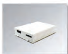
Innebygget Li-ion batteri